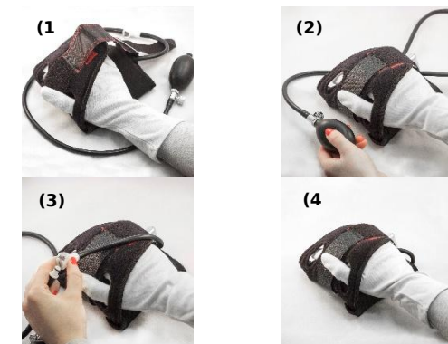
Abbildung 2: Anlegen der pneumatischen Handschiene zum Therapie Beginn

Der beiliegende Handschuh ist vor dem Anlegen der Handschiene immer anzulegen. Er verhindert die Verschmutzung von PNEUMANUS®, ein Scheuern auf der Haut und dient zur Prophylaxe von Infektionen. Folgen Sie den Schritten (1) bis (8) vor erstmaligen Therapiebeginn mit PNEUMANUS®.