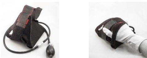
Abbildung 1: Die pneumatische Handschiene PNEUMANUS im freien (li.) und therapeutischen Zustand (r.)

PNEUMANUS® ist eine Handschiene, die der Aufdehnung von aus unterschiedlichen Ursachen in der Streckung behinderten Fingern dient. Die pneumatisch betriebene Handschiene lagert die Finger auf einem Luftkissen. Die betroffenen Gelenke liegen weitgehend frei und unangenehme Druckspitzen auf bestimmte Areale der Finger bzw. der Hand können vermieden werden.